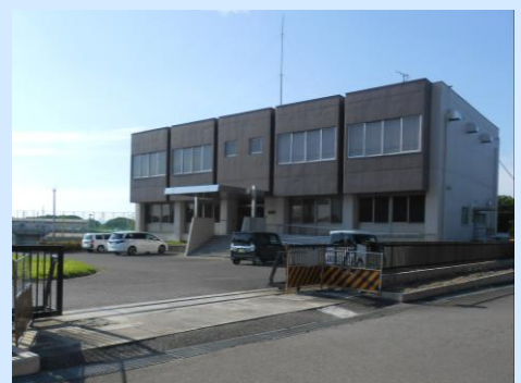
2 中央管理所（江南市宮田町） 名鉄バス停『宮田口』より徒歩2分