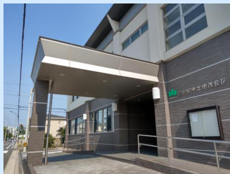
1 本社事務所（稲沢市稲沢町） 名鉄国府宮駅より徒歩16分